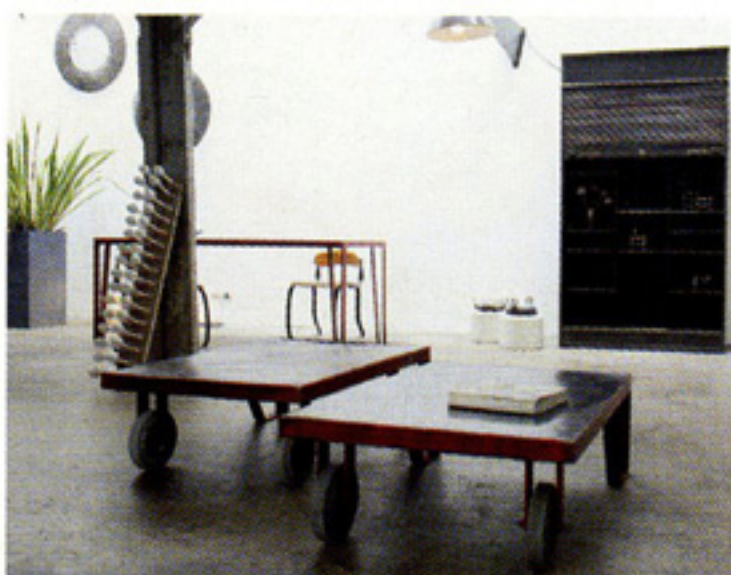
Vues de l'atelier 154