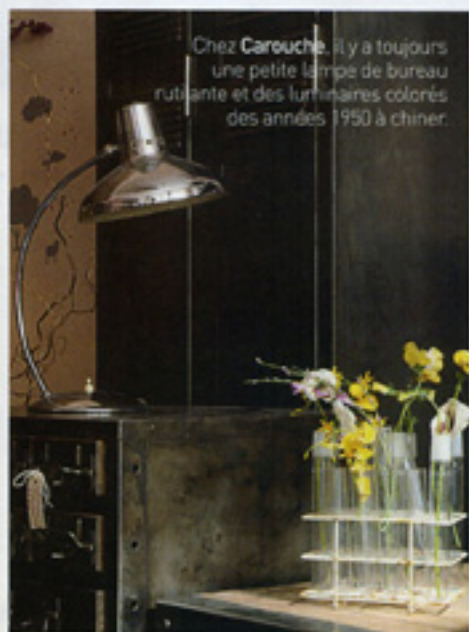
Chez Carouche , il y a toujours une petite lampe de bureau rutilante et des luminaires colorés des années 1950 à chiner.