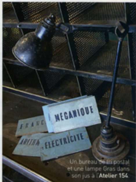
Un bureau de tri postal et une lampe Gras dans son jus à l' Atelier 154 .

émaillée, couramment utilisées comme réflecteurs dans les garages et les ateliers, du plus bel effet lorsqu'on peut en aligner quatre ou cinq à la fois. Plus pointus et spectaculaires, des spots et projecteurs de cinéma ou de studio (Cremer, Lita) ou encore des pièces d'éclairage public – lampadaires, feux tricolores... – se chinent en pièce unique pour parachever sa déco d'intérieur.